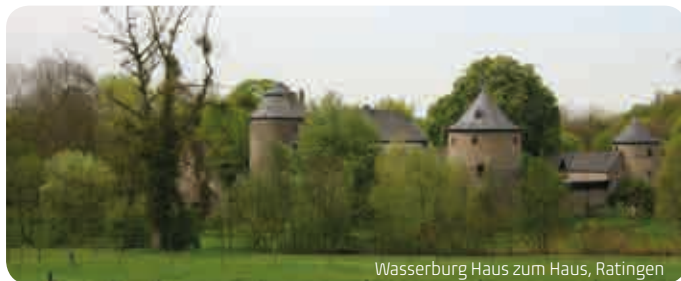
Wasserburg Haus zum Haus, Ratingen

liches Erscheinen am Treffpunkt erforderlich.