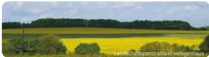
Landschaftspanorama in Heiligenhaus