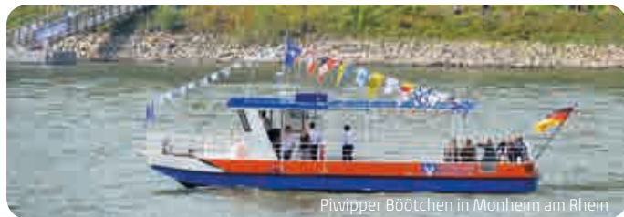
Pwipper Bootchen in Monheim am Rhein

Treffpunkt: Umweltbildungszentrum Heiligenhaus, Abtskücherstraße 24, 42579 Heiligenhaus Anmeldung: erforderlich, bis 10.05. | Kosten: 2 € pro Teilnehmer (Familienpreis 5 €, bis 2 Erw. und 2 Kinder) | Teilnehmer: min. 5, max. 30 | Gästeführer: Hannes Johannsen | Veranstalter: Umweltbildungszentrum und Kulturbüro Heiligenhaus, Tel. 02056-13195, E-Mail: v.kautz@heiligenhaus.de