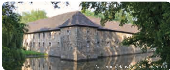
Wasserburg Haus Graven, Langenfeld